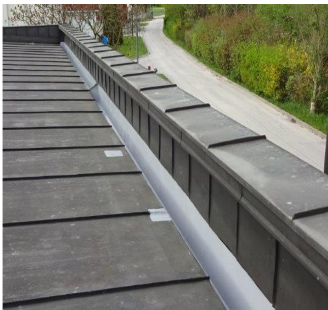
Bočni krovni kanal: